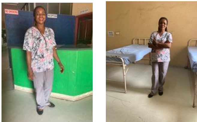
Bild: Sjuksköterska på Mwandi Hospital

Sjuksköterskorna och lokalvårdare som jobbade på sjukhuset fick inte lämna sjukhuset på grund av Covid-19. Detta resulterade i en mycket svår situation då inte hade pengar till att köpa mat och då hjälpte HOPE587 med mat under trettio dagar.